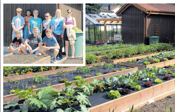
Der neue Schulgarten für das Wahlfach «Gartenbau» der 3. Oberstufe.

theoretischen Inputs und der praktischen Arbeit in die Geheimnisse des Gärtnerns ein: aus Samen Setzlinge ziehen, die Erde umgraben, düngen und Gartenbeete für den Anbau von alten und neuen Gemüsen und Salaten vorbereiten, setzen und säen, hegen und pflegen, Rasen mähen etc. Der neue Schulgarten verspricht ein spannendes Lernumfeld und eine bereichernde Erfahrung für die Schülerinnen und Schüler.