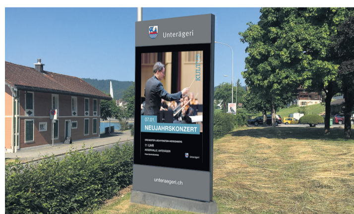
Visualisierung des neuen Screens im Theresiapark