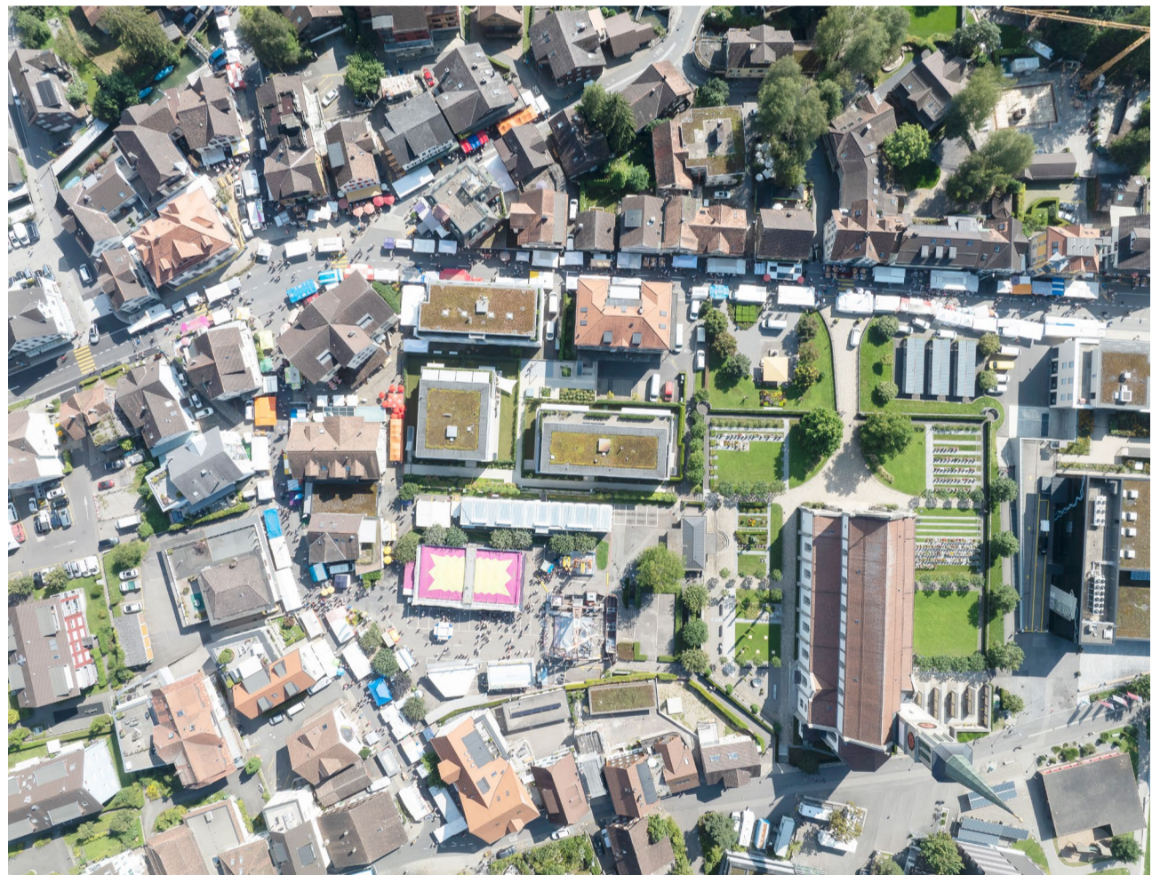
Gelungener Auftakt in den Herbst mit dem Ägerimärcht – hier aus ungewöhnlicher Perspektive.