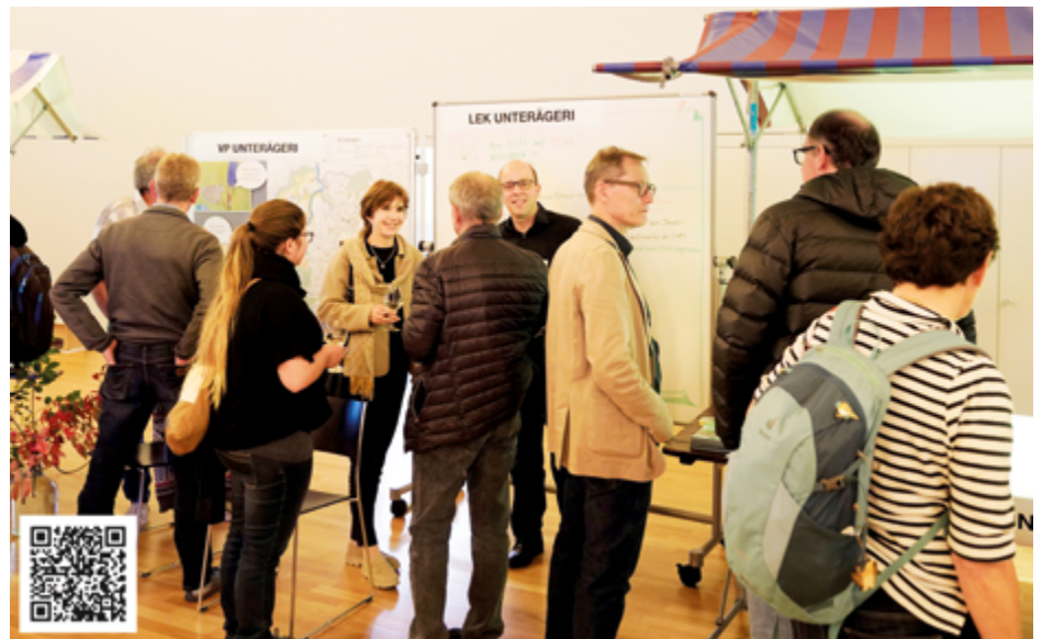
Informationsstand LEK Unterägeri an der Tischmesse vom 6. Oktober 2022 in der AEGERIHALLE – für weitere Impressionen den QR-Code scannen

es Interessantes zu den folgenden drei Themenbereichen zu entdecken: Energie, Umwelt und Mobilität. Es präsentierten sich die folgenden 13 Akteure: Pro Natura, Zuger Vogelschutz, Pro Velo, Wilde Nachbarn Zug, Vernetzungsprojekt Unterägeri, Energie Netz Zug, Korporation Unterägeri, Iten-Arnold Elektro AG, Elektro Iten-Steiner AG, Microlino Küsnacht ZH, Ägerital Energie