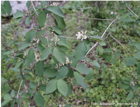
Rote Heckenkirsche (bis 2 m) Lonicera xylosteum

Ein Angebot des Landschaftsentwicklungskonzepts (LEK) Unterägeri