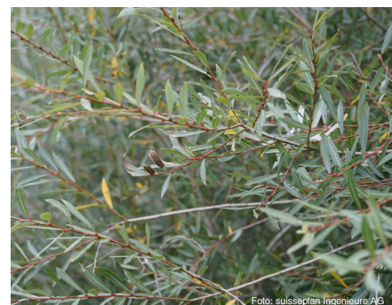
Purpur-Weide (bis 6 m) Salix purpurea