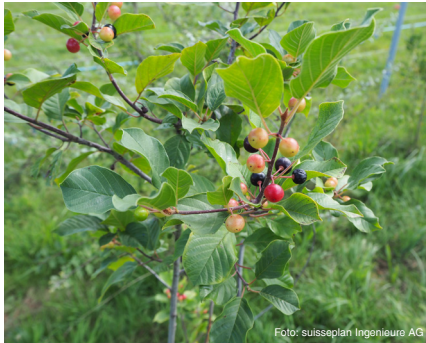
Faulbaum (bis 3 m) Frangula alnus