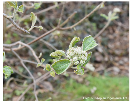
Wolliger Schneeball (bis 5 m) Viburnum lantana