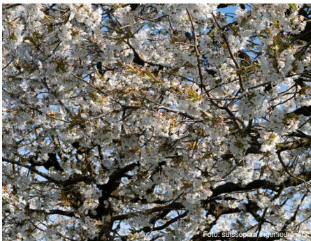
Süsskirsche (bis 25 m) Prunus avium