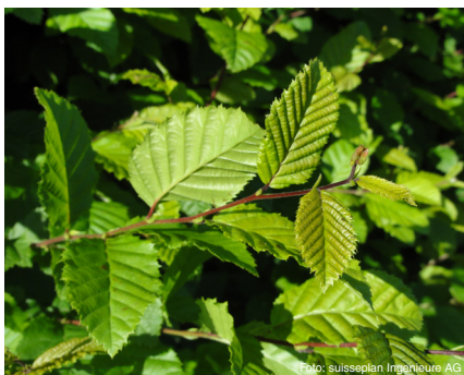
Hagebuche (bis 20 m) Carpinus betulus