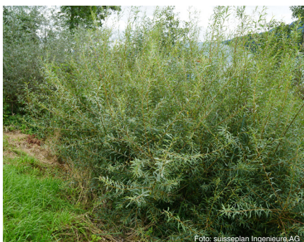
Korb-Weide (bis 16 m) Salix viminalis