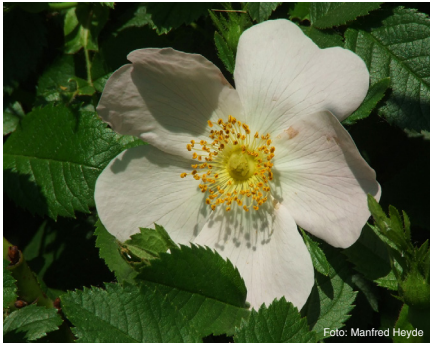
Busch-Rose (bis 3 m) Rosa corymbifera

Ein Angebot des Landschaftsentwicklungskonzepts (LEK) Unterägeri