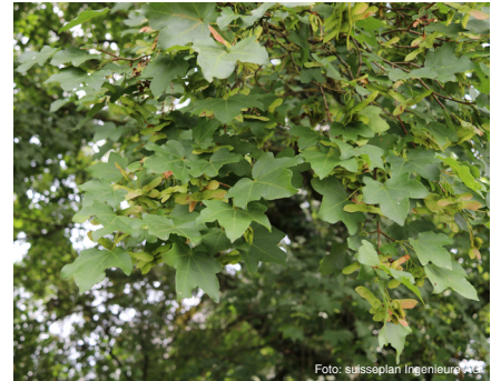
Feld-Ahorn (bis 15 m) Acer campestre