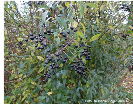
Gemeiner Liguster (bis 4 m) Ligustrum vulgare