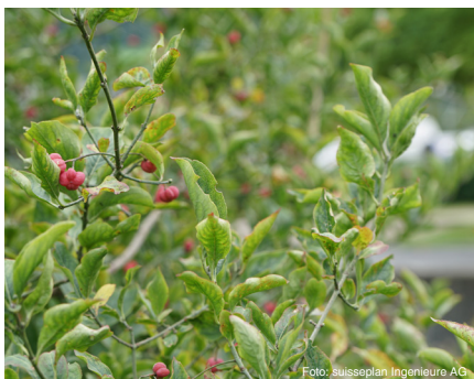
Gemeines Pfaffenhütchen (bis 5 m) Euonymus europaeus