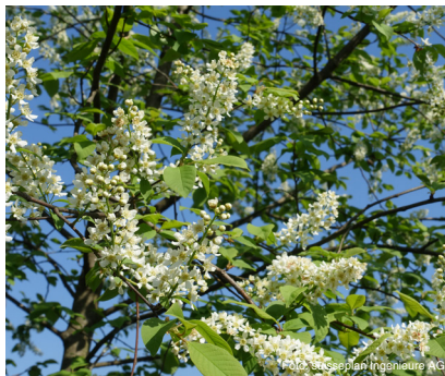
Traubenkirsche (bis 10 m) Prunus padus