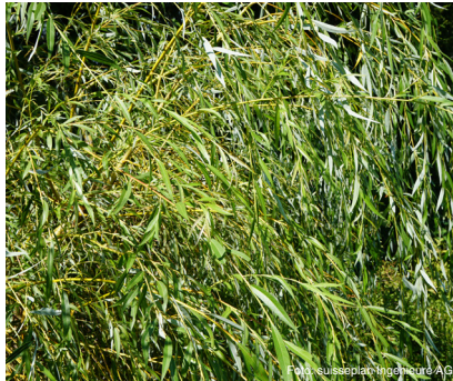
Silber-Weide (bis 20 m) Salix alba