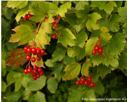
Gemeiner Schneeball (bis 4 m) Viburnum opulus