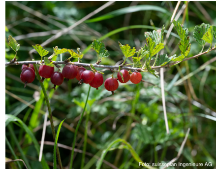
Stachelbeere (bis 1.5 m) Ribes uva-crispa