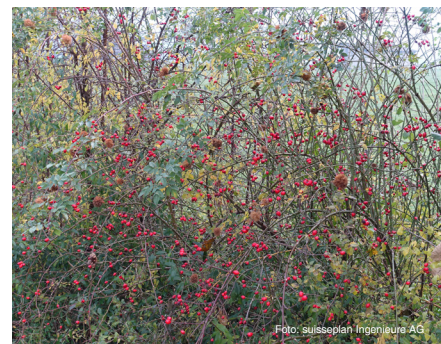
Hunds-Rose (bis 4 m) Rosa canina