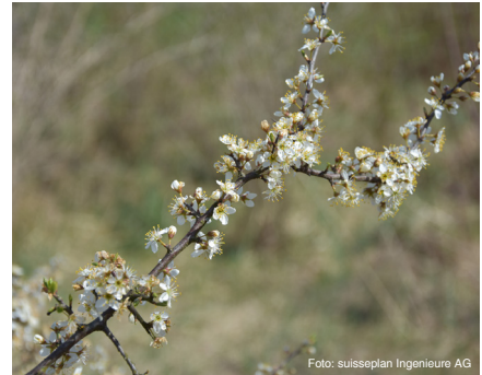
Schwarzdorn (bis 3 m) Prunus spinosa