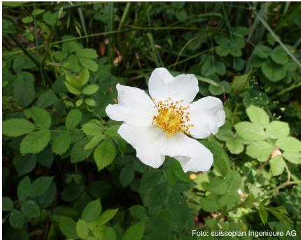
Feld-Rose (bis 1 m) Rosa arvensis