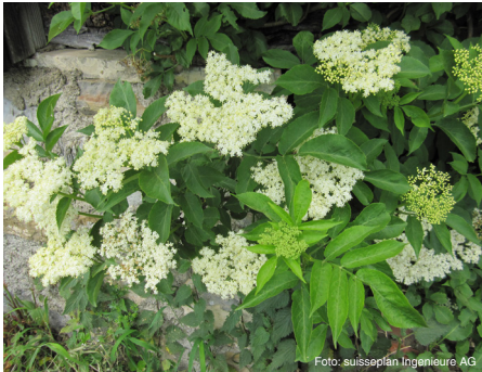
Schwarzer Holunder (bis 7 m) Sambucus nigra