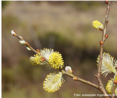
Sal-Weide (bis 9 m) Salix caprea